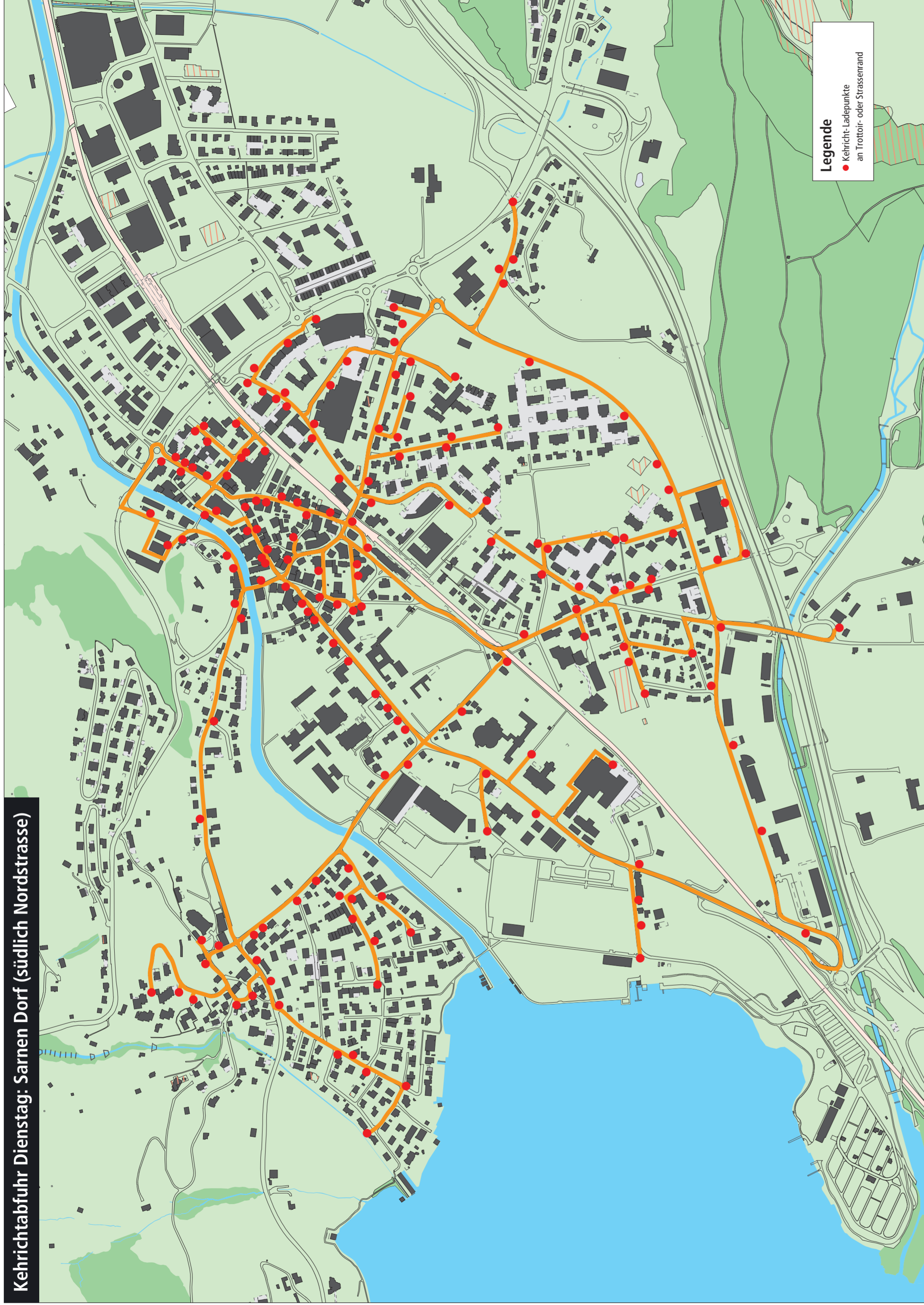
Kehrriichtabfuhr Dienstag: Sarnen Dorf (südlich Nordstrasse)