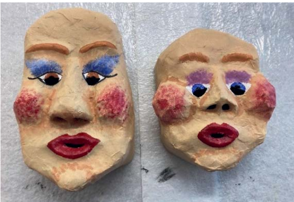
Rohe Pappmaché-Maske grundieren und bemalen