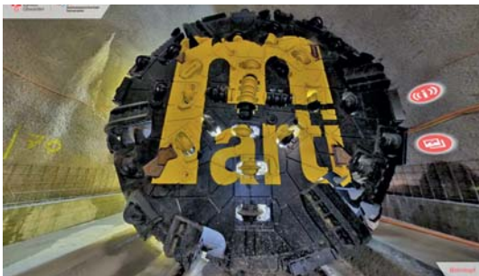
Screenshot des virtuellen Baustellenrundgangs mit der Tunnelbohrmaschine im Fokus