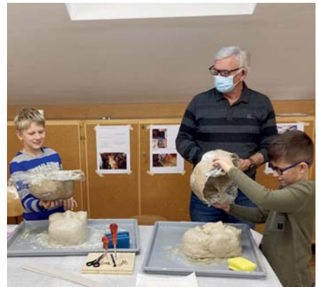
Pappmaché-Masken vom Ton lösen – ein grosser Moment!