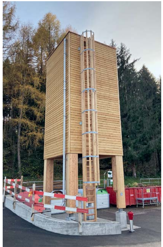
Neues Salzsilo aus Holz beim Werkhof Wolfgrube in Stalden

Aus diesem Grund hat sich der Einwohnergemeinderat dazu entschieden, auf den Winter 2020/2021 ein fixes Silo aus Holz, analog beim Werkhof in Sarnen, zu installieren. Das neue Salzsilo, mit einer Füllmenge von 60 m 3 , steht seit Mitte November 2020 für den Einsatz bereit.