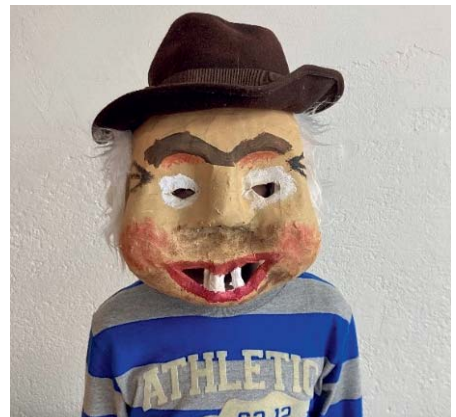
...Haar und Hut und und fertig ist der Gratulant!