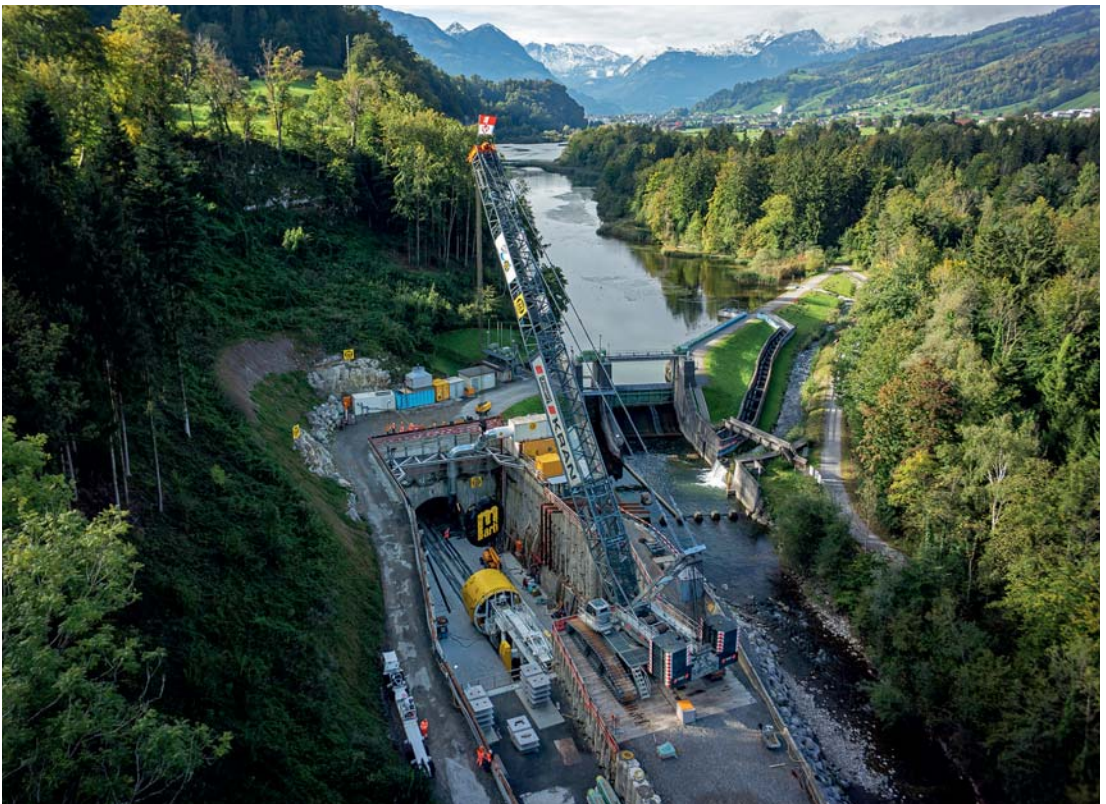
Blick auf den Portalbereich des Hochwasserentlastungsstollens nördlich des Wichelsees

Ursprünglich war am 7. November 2020 der «Tag der offenen Baustelle» vorgesehen. Die Bevölkerung hätte an diesem Tag die Baustelle des Auslaufbauwerks des Hochwasserentlastungsstollens vor Ort entdecken können. «Aufgrund der aktuellen Covid-19-Situation haben wir uns aber im Oktober dazu entschlossen, die Idee des «Tags der offenen Baustelle» nicht weiter zu verfolgen