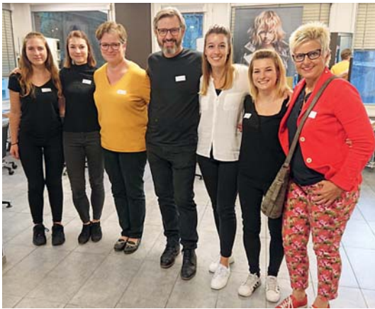
Teilnehmende und die Kursleiterin der Schulung im Coiffeur-Salon Fanger hair and more, Sarnen

Zehn Personen haben mit Engagement teilgenommen und sich mit eigenen Erfahrungen und Fragen aus ihrem Berufsalltag eingebracht. Dabei wurde spürbar, dass den Coiffeusen und Coiffeuren nicht nur eine gute Frisur ihrer Kundschaft ein Anliegen ist, sondern ihr Wohl generell.