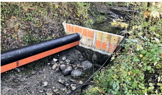
Fassung und Ableitung Wasser

Von unten her sind bereits die ersten Blocksteine gesetzt. Die Bauarbeiten werden bis ca. Ende November 2019 dauern.