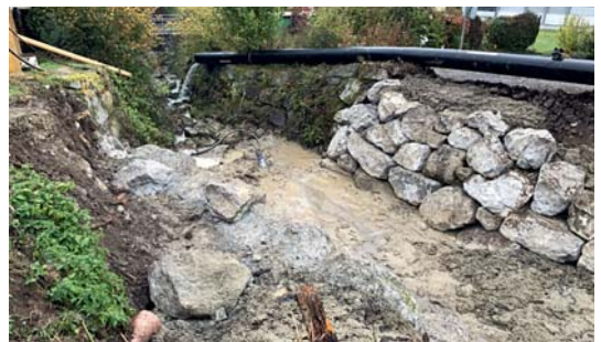
Erster Blocksatz im untersten Teil der Baustelle