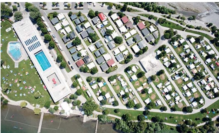
Areal Schwimmbad- und Campinganlage Seefeld Park, Sarnen