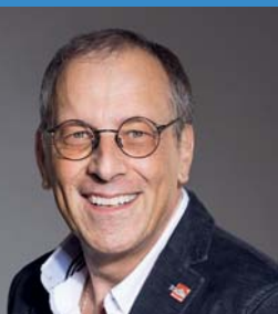
Liebe Sarnerinnen und Sarner

Mit der «Siedlungsentwicklung nach innen» setzen sich Planungsfachleute und Baubehörden bald seit Jahrzehnten auseinander und sind immer wieder mit der Komplexität der Thematik konfrontiert.