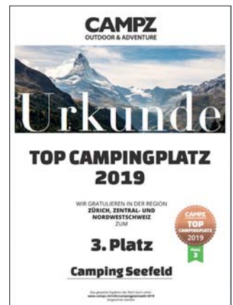
Urkunde über den 3. Platz des Online Votings der Firma CAMPZ