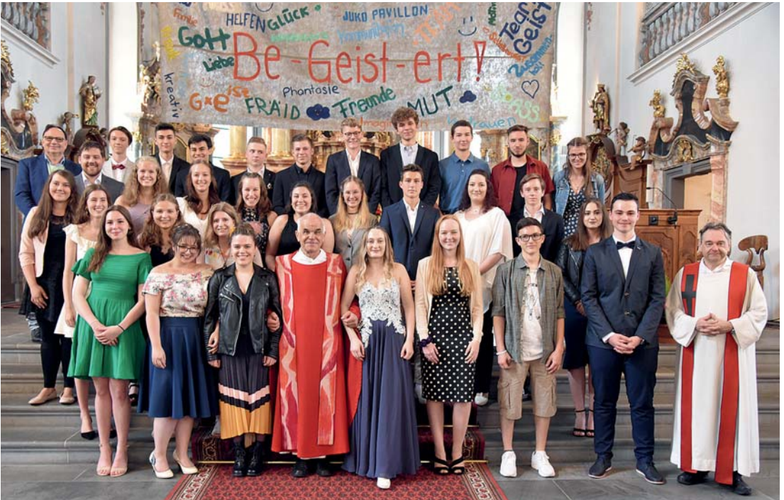
Firmung Sarnen vom Samstag, 22. Juni 2019