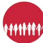
Gemeinschaft zäme underwägs