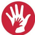
Generationen Chilä fir jung & alt