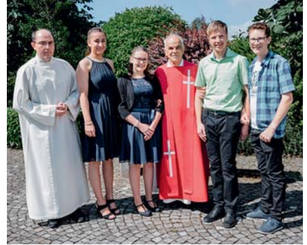
Firmung Schwendi vom Sonntag, 23. Juni 2019