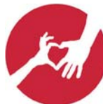
Frohbotschaft zuälösä und witergäh