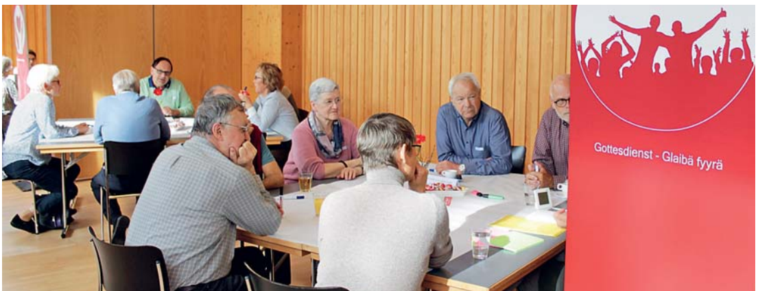
Gesprächsrunde beim Posten «Gottesdienst Glauben feiern»