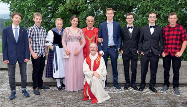
Firmung Kägiswil vom Samstag, 22. Juni 2019

Mögen unsere gefirmten jungen Menschen ihre Begeisterung für den Glauben mit der Kraft des Heiligen Geistes nie verlieren und ihre Ziele im gestärkten Glauben erreichen.