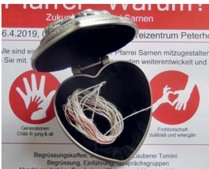
Faden in Herz

Daraus könnte man drei bis vier Projekte erarbeiten, diese vorstellen und zur Mitarbeit aufrufen. Wir möchten aber einen Weg der Interaktion und der Mitbeteiligung gehen und alle Teilnehmenden des Zukunftstages, wie auch weitere Interessierte, zu einem Gesprächsabend einladen, um die Ergebnisse miteinander zu diskutieren, Projekte zu definieren und dazu Arbeitsgruppen zu bilden.